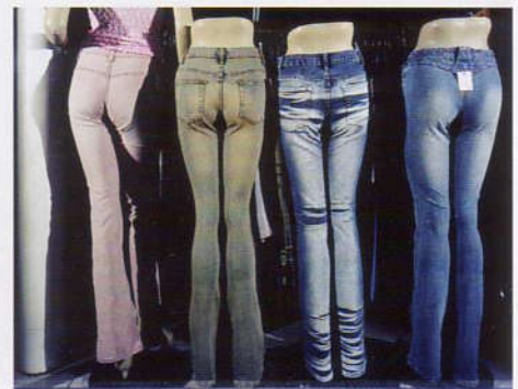
Vitrines (Schaufenster), 2004-2007, Color Print, 124 x 91 cm, 2400 Euro