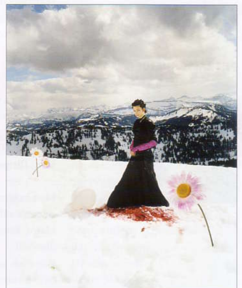
Kristallkrämer , aus der Serie ohne Titel, 2007, C-Print auf Dibond, 90 x 76 cm, 1600 Euro

Männer sagen, unsere Kunst sei weiblich. Unsere Kunst ist jenseits von Wahrheiten, inszeniert in Anderswelten, vielschichtig und interdisziplinär. In fünf Jahren sind wir im deutschen Pavillon. Unsere Lieblingskünstler sind zahlreich, oft zeitgenössisch, manchmal so alt wie Methusalem, aber immer Brüder im Geiste.