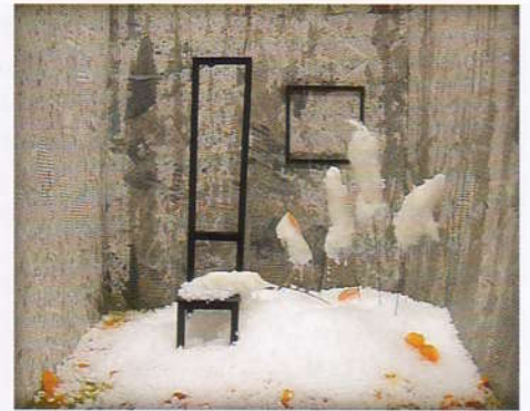
Our Darkness , 2006, Video (DVD), 6'17", Edition von 5 + 2 E.A., 2300 Euro

Man sagt, meine Kunst sei einfühlsam. Meine Kunst ist Fokus, Wahrnehmung und Ausdruck. Wäre ich nicht Künstlerin geworden, wäre ich gern unwissend geblieben. In fünf Jahren mache ich nur noch das, was mich wirklich interessiert. Mein Lieblingskünstler ist Robert Wilson.